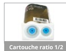
Cartouche ratio 1/2