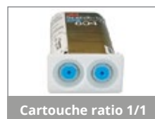
Cartouche ratio 1/1