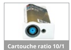
Cartouche ratio 10/1