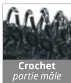
Crochet partie mâle