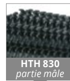
HTH 830 partie mâle