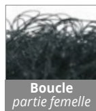
Boucle partie femelle

Boucle/crochet : Standard, le + endurant - Boucle/champignon : Agrippant + puissant Velours/champignon : Couple fin et design - Boucle/crochet HTH 830 : Couple très fin