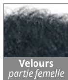
Velours partie femelle