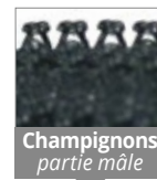
Champignons partie mâle