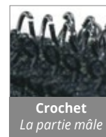
Crochet La partie mâle

Pour avoir les 2 parties "scratch", choisissez "boucle & crochet"